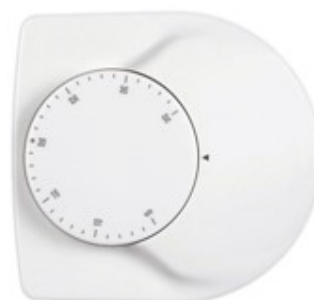
78mm x 85mm x 34mm

El Termostato mecánico de ambiente Euterma HT-03 está diseñado para proporcionar control automático para el actuador térmico, válvulas de control eléctrico, etc. en instalaciones de calefacción. Los usuarios consiguen una calefacción más cómoda y económica ajustando la temperatura según las necesidades.